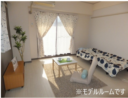
※モデルルームです