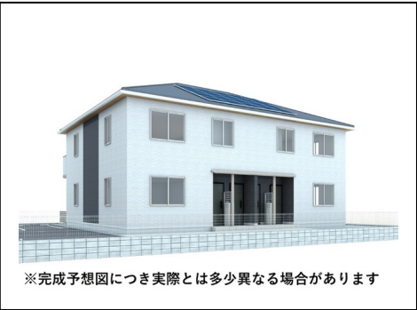
※完成予想図につき実際とは多少異なる場合があります