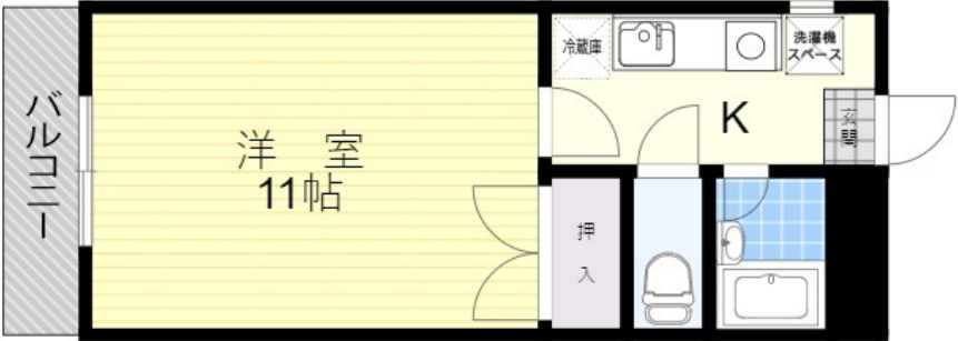
※略図につき、現状を優先します。

取引態様 一般媒介 物件種別 マンション 物件番号 26006006830007