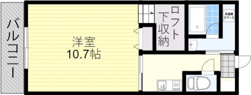
※図面と現況が異なる場合は、現況を優先いたします。